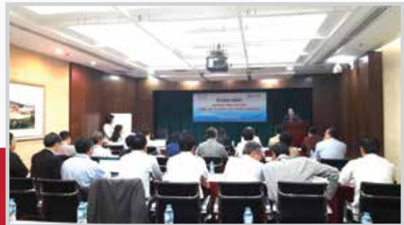
Chuỗi đào tạo cho nhân sự cấp cao của EVN với chuyên đề về kiểm toán nội bộ, quản trị tài chính, quản trị rủi ro