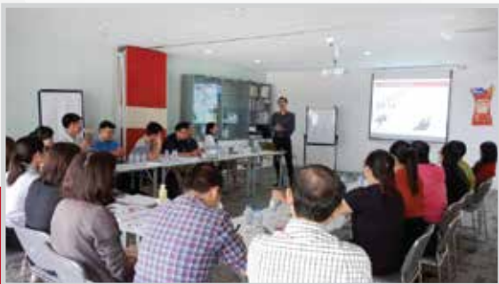
Khóa học “Phân tích tài chính” do Smart Train thực hiện tại Kimberly Clark Việt Nam

Dịch vụ tổ chức và quản lý lớp học chuyên nghiệp, bài bản trước, trong và sau khóa đào tạo