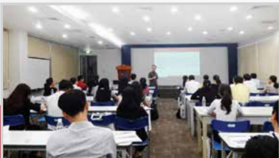
Smart Train tổ chức khóa học “Quản lý rủi ro gian lận” tại VSIP Bình Dương