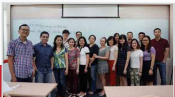
Học viên PV Oil tham gia khóa đào tạo “Phân tích tài chính” tại Smart Train